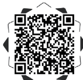
扫一扫, 和网友一起讨论吧。