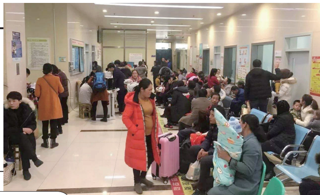
在湖南省人民医院儿科门诊，不少家长正排队等候。

1月15日，今日女报/凤网记者走访长沙市多家医院了解到，匹多莫德风波后，儿科单日门诊量大大增加，不少家长担心孩子用药后产生副作用。那么，拒绝匹多莫德，医生还有哪些办法增强孩子抵抗力呢？