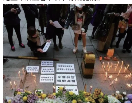
金毛犬死亡后，爱狗人士自发悼念。

另外，我们还应该了解另一个法律知识——爱狗人士该不该传播虚假信息？比如，从该热点事件来看，网友把民警执法的照片、证件照以及狗被打死的血腥照片发到朋友圈，并配文：“四个小时，把一只拴着的金毛活活打死”就已涉嫌造谣，将根据《中华人民共和国治安管理处罚法》的规定，散布谣言，谎报险情、疫情、警情或者以其他方法故意扰乱公共秩序的，可以处五日以上十日以下拘留，五百元以下罚款。编造虚假的险情、疫情、灾情、警情，在信息网络或者其他媒体上传播等严重扰乱社会秩序的，将构成编造、故意传播虚假信息罪，处三年以下有期徒刑、拘役或者管制；造成严重后果的，处三年以上七年以下有期徒刑。