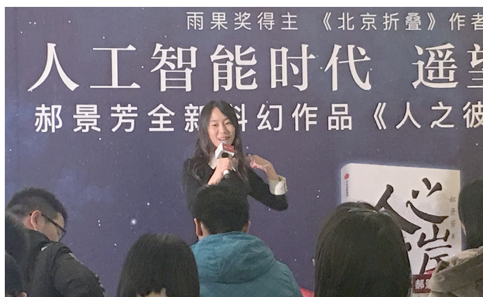
郝景芳与读者交流人工智能。