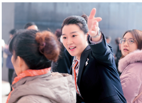
工作人员的耐心杠杠的。

这个冬天，张学友演唱会之后，人山人海的场景再次在长沙出现了。只是这一次出现的地方颇让人意外：湖南省博物馆。