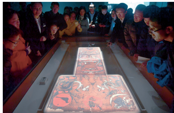
看帛画，时光越千年。