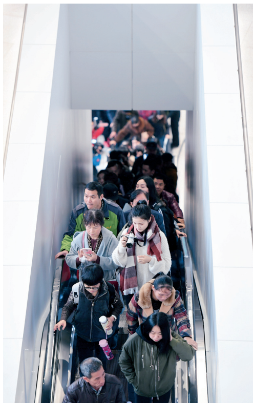
电梯里是这样子的。