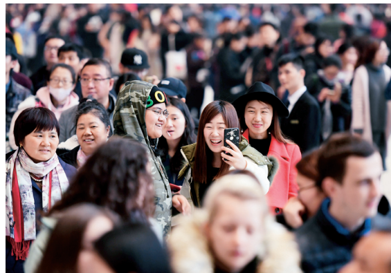
有了自拍，排队不累。