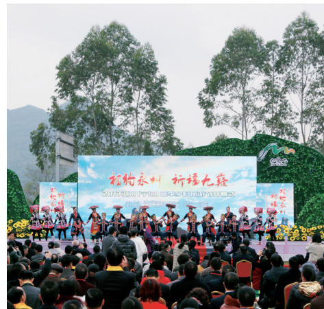
2017年湖南省冬季乡村旅游节在永州市宁远县湾井镇下灌村开幕,吸引2万多名游客和市民前往观光游玩。

本届乡村旅游节活动时间为11月21日至23日,活动期间,可了解到永州各大景区、乡村旅游、现代民宿、旅游商品等旅游业态,更有独具宁远特色的绿色产品展销,以及蝴蝶画、木雕等宁远非物质文化遗产,展现一个不一样的“苍梧之野”、“福地乡土”。此时此地,还可遍尝永州风味小吃,尽享一场“吃货”的饕餮盛宴。