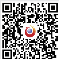
扫一扫，看边检“警花”背后的故事

每个平凡岗位的背后，都有着不平凡的故事。就像湖中一只美丽的白天鹅，我们只看到它优雅地在湖中嬉戏，却看不见它的两只鹅掌正在奋力击水。长沙边检站的官兵们，每天工作在长沙黄花国际机场，我们只看到他们忙碌的身影，却不知道他们背后有着许多动人的故事。11月8日，今日女报记者采访其中两位“学霸警花”。