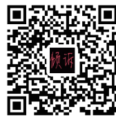
扫码分享这个故事

几天后，女友发微信给我，叫我去接她。她说，只要我对她好，并且以后努力工作，好好规划生活，存钱买房，她就再给我一次机会。听她这样说，我感动不已。因为，她真的是爱我这个人，而不是传家宝啊！我也想通了，我年纪轻轻身体健康，为什么要指望一个传家宝，而不凭自己的努力在大城市立足呢？