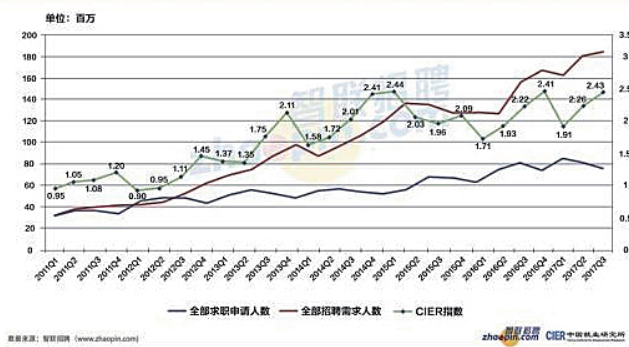
2017第三季度申请、需求人数和CIER指数变动趋势

去年同期水平；二季度受企业用工需求增加，以及求职申请人数下降的影响，CIER 指数上升至 2.26；进入第三季度，受宏观经济增长的持续影响，企业招聘人数出现小幅上升，而同期的求职申请人数出现一定程度的回落，使得 CIER 指