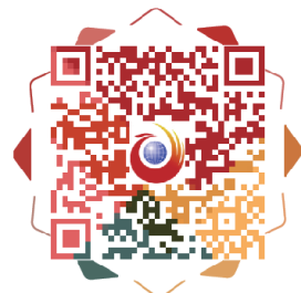
扫一扫看视频，女画家自述作品背后的故事