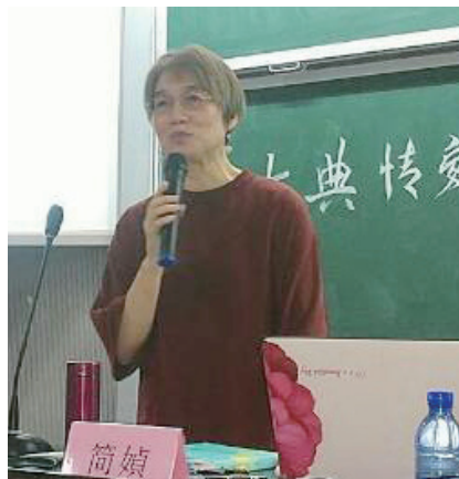
简媜首次在湖南举办讲座。