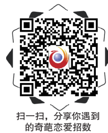
扫一扫, 分享你遇到的奇葩恋爱招数

今日女报/凤凰网记者 罗雅洁 PUA是什么? 全称为“Pick-up Artist”, 也就是“搭讪专家”。也许你听过“如果她涉世未深, 就带她看遍世间繁华; 如果她历经沧桑, 请带她坐十次木马”这句话, 里面蕴含的“触中痛点, 投其所好”其实就是PUA的一部分。但近日网络上流传一份价值29800元的PUA教程, 所教授的恋爱套路却让人大呼奇葩和尴尬。