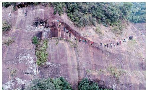
要是没有航拍“飞机”，摄影师会为这一幕伤透脑筋。