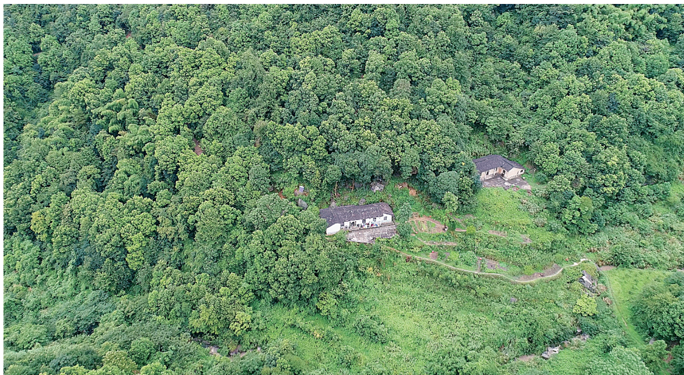
望城茶亭镇山间民居，适合隐居么？