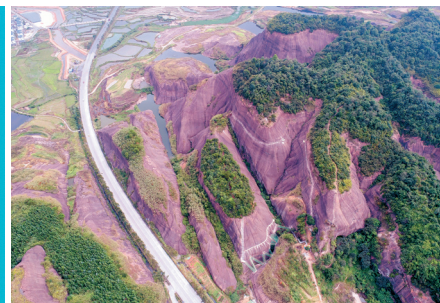
郴州高椅岭，俯瞰丹霞群峰。