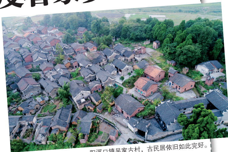
阳溪口镇吴家古村，古民居依旧如此完好。

换个角度看家乡，原来房前屋后这么美！最后提醒一句：欣赏照片之余，不妨想一想，你是不是曾经出现在照片里的某个位置？