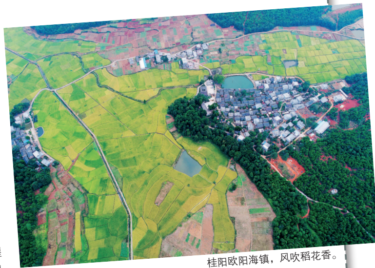
桂阳欧阳海镇，风吹稻花香。