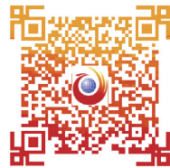
扫一扫， 为这个姑娘支招

以前，买房是男人的事，可现在有很多单身女人买房热情也很高，她们想在婚前给自己买一套房，因为现在的女人越来越独立，越来越努力，她们完全有能力自己买房。但对于在长沙工作的外地女孩来说，可能一夜之间就丧失了长沙买房的资格。9月23日，长沙市住建委发布新一轮的楼市调控政策，其中就规定外来户想在长沙买房，需要出具24个月以上的所得税或社保缴纳证明，这让很多想买的外地女孩望房兴叹。但有人突发奇想，想通过“购买”来取得买房资格。那如果你的男友跟你说，他想“出售”自己的购房资格给一个外地单身女孩，你会怎么做呢？