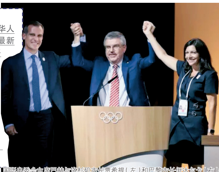
国际奥委会主席巴赫与洛杉矶市长贾希提（左）和巴黎市长伊达尔戈（右）。

那么，法国巴黎和美国洛杉矶这两个西方发达国家的城市，为何又要举办传说中“吃力不讨好”的奥运会呢？来看看这两个城市的市长怎么说吧。