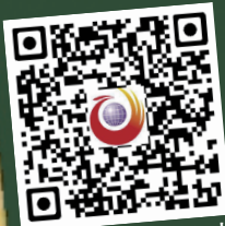
扫一扫, 看医生支招牙齿健康视频

文: 今日女报 / 凤网 见习记者 刘彦宇 你还以为“牙疼不是病”吗? 其实“牙疼”也要人命!