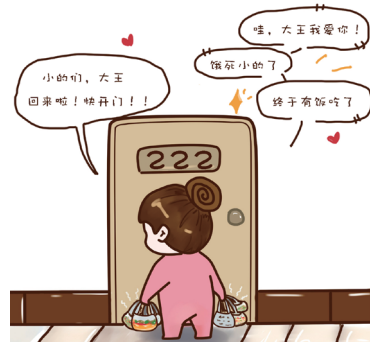
4, 冬天给我们买饭, 夏天给我们买水, 她是我们的“大王”。