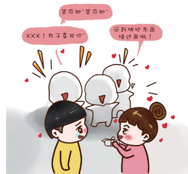
3, 她们会鼓励你做很多不可能的事。

有些事情, 如果不是有人帮忙、感恩、或者是混乱, 也许自己永远都不会做, 永远也鼓不起勇气。