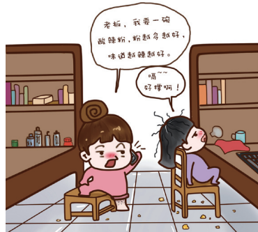
1, 初见和久见, 形象大不同。