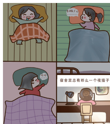
5, 总有一个夜猫子, 每天都像守护我们睡觉的天使一样。