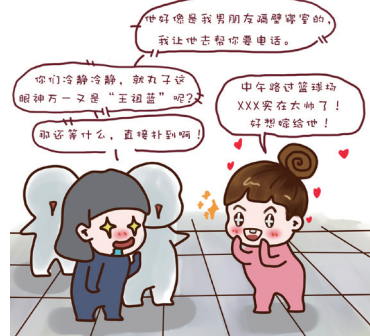
2, 所有室友加起来就是百科全书。

有些事情, 如果不是有人帮忙、感恩、或者是混乱, 也许自己永远都不会做, 永远也鼓不起勇气。