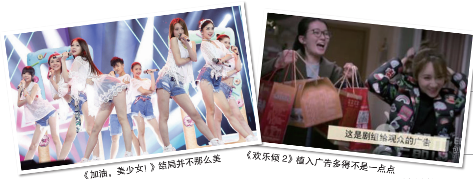
《加油，美少女！》结局并不那么美

随着影视和综艺类节目升温，各大电视台招商广告的金额越来越高，广告商也越来越大手笔，动辄就砸数亿元广告费进来。广告费不断突破“天花板”，一方面，节目组获得了充足的资金，能够更自由、大胆地创作；但另一方面，这也使得广告成为影视作品里的“大爷”，恨不得99%的时间都由广告来做主。殊不知，广告好谈，节目好做，但真实的收视率和观众的心却不是那么好忽悠的。