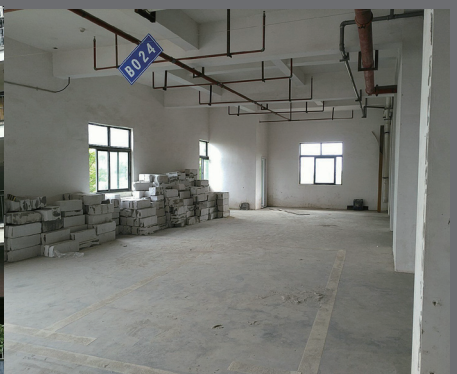
车位围住将变成了房子