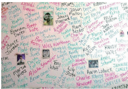
在俄亥俄州派克顿戒毒中心的墙上，密密麻麻地写着因吸毒死亡的人的名字。

由美国现实主义保守派建立的网站“amerika.org”甚至发起了讨论，主题是“哪里能找到好女人？答案在‘铁锈地带’”。