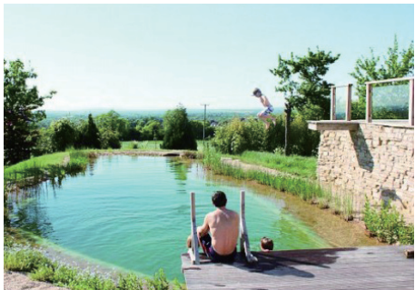
大自然泳池夏天是游泳避暑的好地方，冬天则是景观。

事实上，大自然泳池并非英国首创，这种技术最早出现在30年前的奥地利，之后在整个欧洲逐渐流行。如今，欧洲约有500座公共大自然泳池。