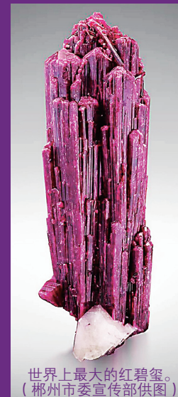
世界上最大的红碧玺。(郴州市委宣传部供图)

文、图：今日女报 / 凤网记者 刘洋 5月22日，为期五天的第五届中国(湖南)国际矿物宝石博览会(以下简称“矿博会”)圆满收官。据最新数据显示，本次展会参观人数达33.6万人次，交易总额19.3亿元人民币，参观人数、交易总额再创新高，分别比上届分别增长5%、10%。