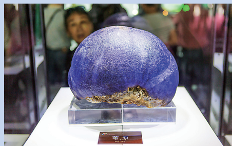
世界上最大的单体萤石球。

第六届矿博会希望借此新口号、新主题，扩大国际影响，吸引更多的外商、藏家、政要、学者参加矿博会，助推矿物宝石产业的持续发展和科学发展，使郴州成为国际矿物宝石的集散中心，成为“一带一路”矿物宝石合作的国际示范基地。