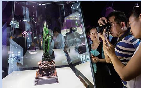
精美的矿石吸引游人驻足拍照。