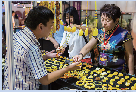
游客在矿博会上淘宝。