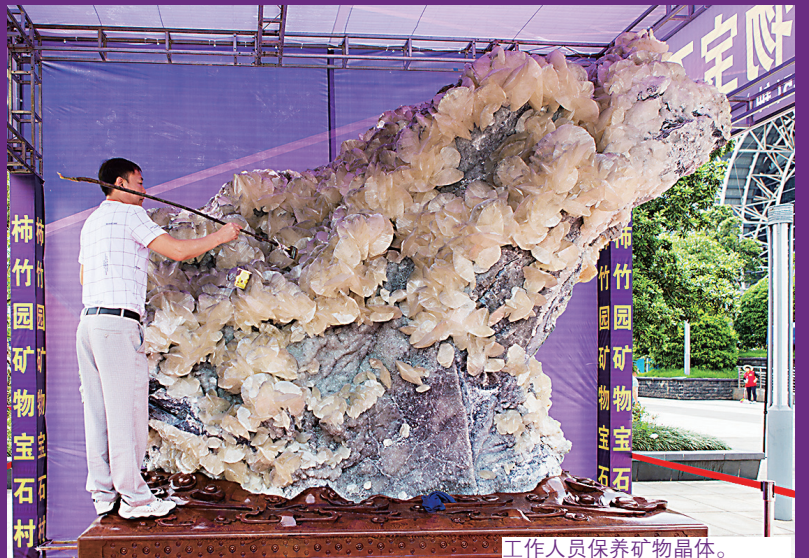
工作人员保养矿物晶体。

本届矿博会继续坚持了“汇聚全球资源，打造国际品牌，扩大交流合作，弘扬科学文明”的宗旨，以“神奇的矿晶，多彩的萤石”为主题，以地学科普与国际交流为核心，将郴州“世界有色金属博物馆”、“中国矿物晶体之都”的形象展示在全世界的面前。