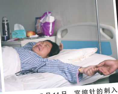
5月14日,宫缩针的刺入,扎碎了她当母亲的心愿。