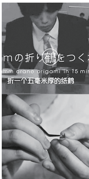
热点 | 做外科医生，先得 15 分钟折出 5 毫米纸鹤

近日，走红的日本医生选拔视频里，一个磁性的男声介绍了本次考试的原由：“所有医生都是学霸，但他们并不是生搬硬套书本的知识来为我们做手术……”于是，想做外科手术医生，先得完成三项挑战——15 分钟内完成一只 5mm 的千纸鹤、15 分钟内按照图示重新组合所给昆虫、15 分钟内在一粒米上制作寿司。