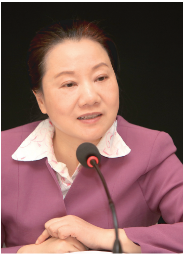
姜欣（湖南省妇联党组书记、主席）