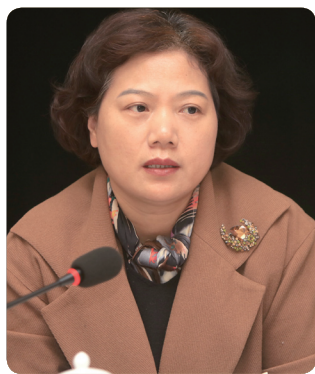
卢妹香（湖南省妇联副主席）