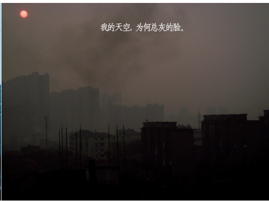
我的天空,为何总灰的脸。