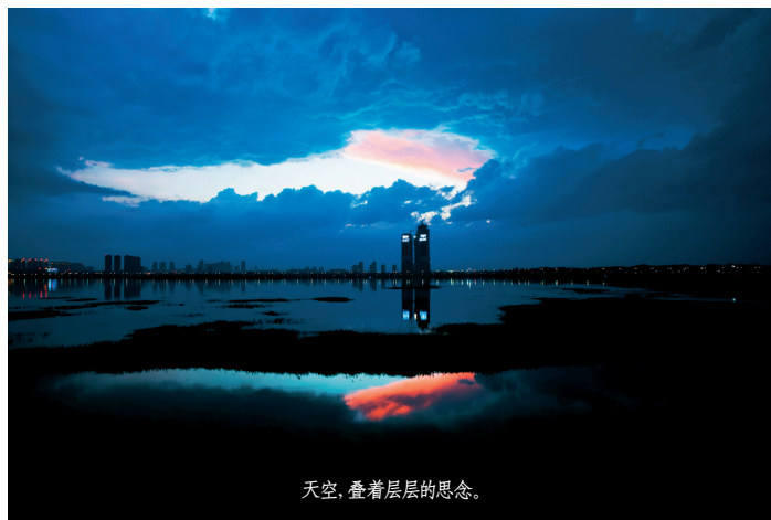
天空,叠着层层思念。