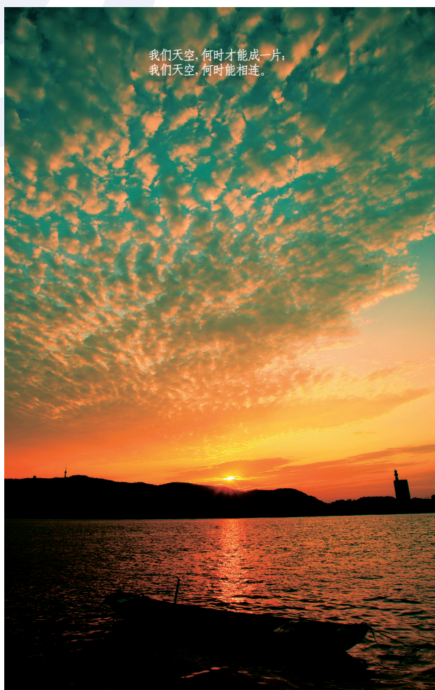
我们天空,何时才能成一片; 我们天空,何时能相连。