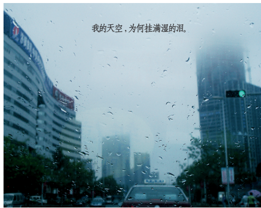
我的天空,为何挂满湿的泪。