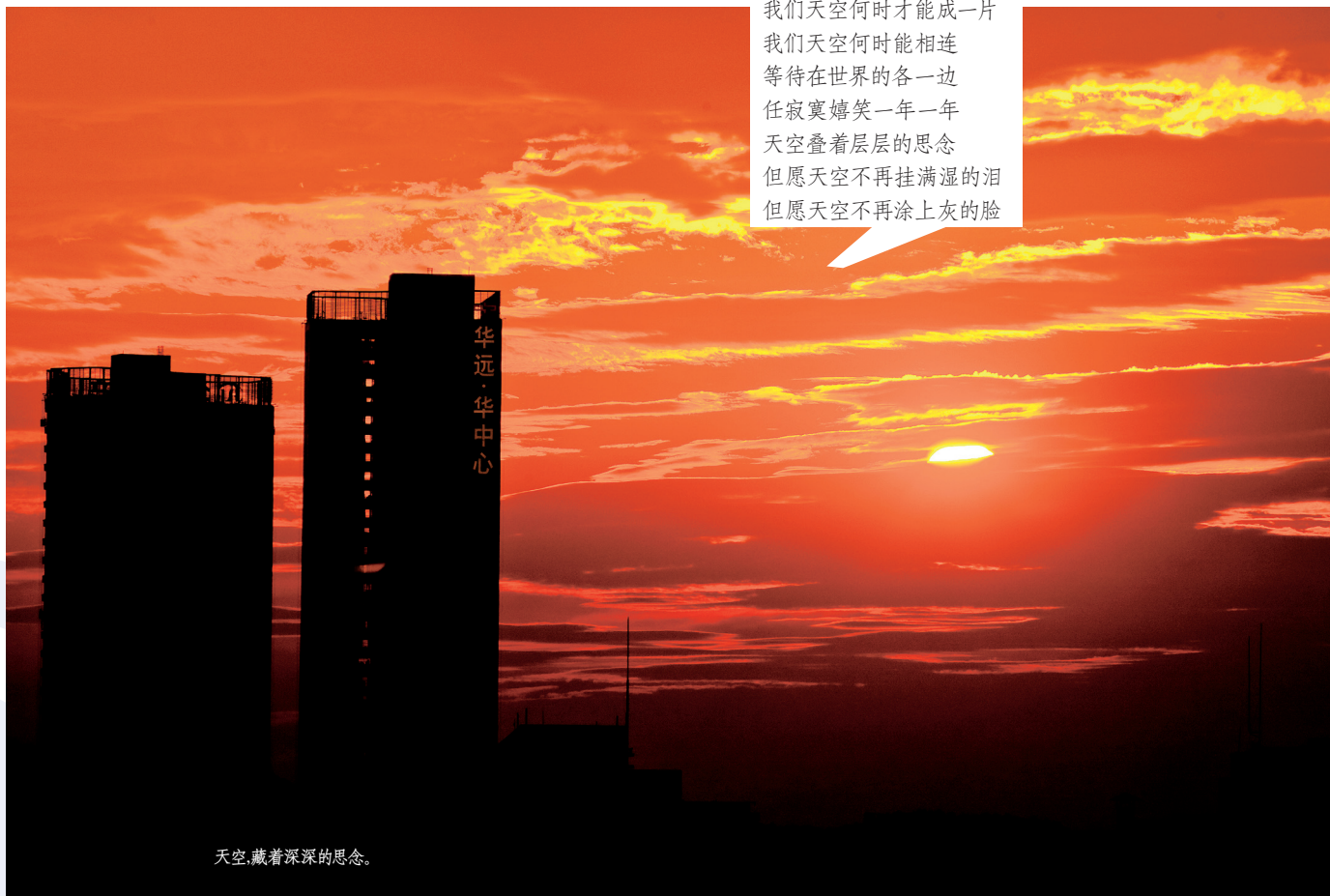
天空,藏着深深的思念。

于是,我们把这组图片都配上一句歌词,如此贴切,如此动容。在春雨连绵中,我们反复品味这组片子,反复咀嚼这首歌曲,思绪染开,情意放散。日子,便舒展开来,编织成我们波澜壮阔或涟漪不惊的生活。