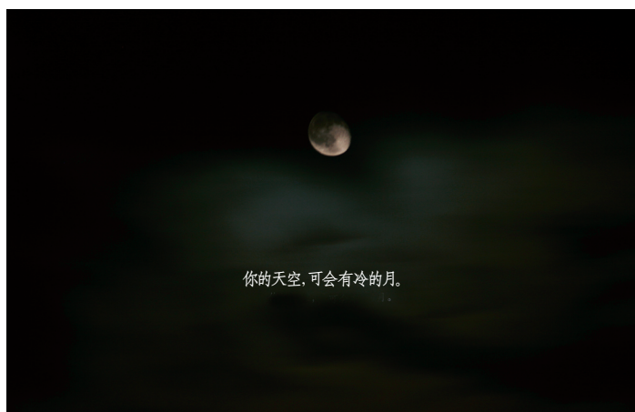
你的天空,可会有冷的月。