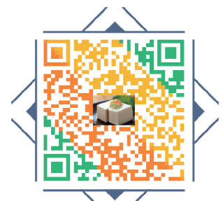
扫一扫 在家也能自制美食