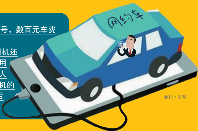
制图 / 雨梦

文、图：今日女报 / 凤网记者 陈炜 开网约车接单，却发现对方约车手机号突然变空号，数百元车费无处讨。长沙网约车司机张文华最近郁闷不已。 春节过后，与张文华有同样遭遇的长沙网约车司机还不少，一些乘客不知使用什么方法，乘车前正常使用的电话号，下车后就能成“空号”，高额的车费随之人去钱空。这些人怎么成了“霸王乘客”？网约车司机的损失又该如何追查寻得弥补？今日女报 / 记者调查后发现了这其中的秘密。