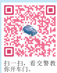
扫一扫，看交警教你开车门。

像荷兰人那样用离车门最远的手去开车门，强迫自己扭动身体向后看，只需要转变一个思维习惯和行为习