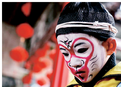
▲“孙悟空”扮相深受孩子喜爱,能“抢”到这个角色,孩子会很高兴。