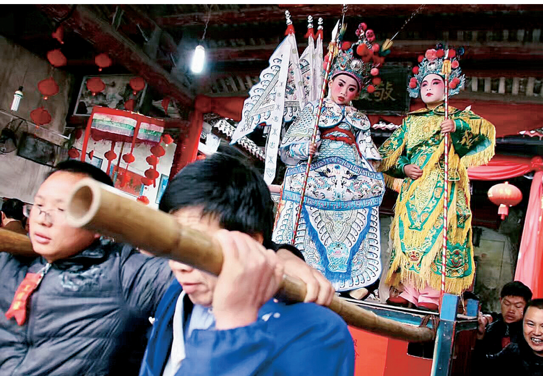
▲午很但站的能 上演,后合不 一表苦妆架子动。 的幸化上孩乱。