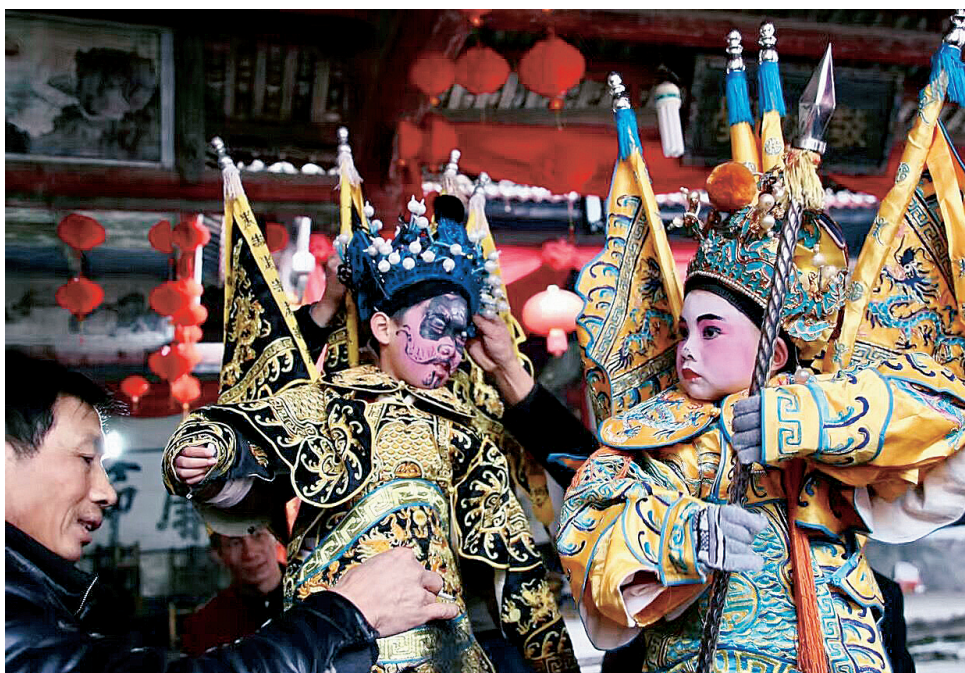
街寒演戴上望穿 春旧小,们套希 初依,们手套希 头冷,员着台,不帮。