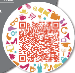
扫一扫，健康知识转起来

2月6日，今日女报/凤网记者从长沙市口腔医院了解到，春节期间(1月21日—2月6日)，因口腔问题前来医院求诊的患者约有18011人，其中，牙周黏膜科门诊有1253人，不乏需要割掉部分舌头的癌变患者。为此，长沙市口腔医院专家收集了不同患者舌像，用照片教你识别“舌尖上的健康”。