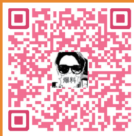
扫一扫听张国立读家信

古诗与信件，似乎离现代社会有些遥远，也显得有些冷门。如今，当这些过去年代里的韵味搭上综艺的快车并带来一股热潮，究竟是意料之外，还是情理之中？