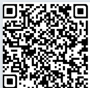
扫一扫 了解“蒲公英姐姐”更多故事