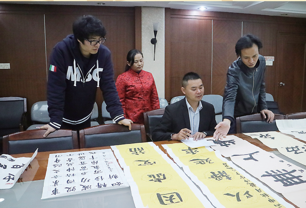
湖南省女书协、省青书协派出的专业评委对孩子们的家风书法作品进行现场点评。

今日女报 / 凤网讯（记者 吴雯倩）大楷、行书、魏碑、隶书……各种字体；7岁、9岁、12岁……小小少年。他们，用书法展示美好家风！11月4日，“美好家风写下来”少儿书写大赛定评会在长沙举行，代表湖南书法高水平的专业评委现场揭晓出一、二、三等奖及十佳作品、优秀作品等各类奖项。