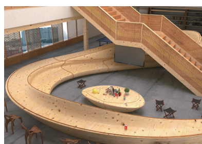
大学生专为农民工设计的“砼人旅馆”设计稿内景。