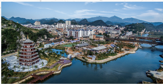
南湖公园将是城步市民休闲娱乐的好去处。