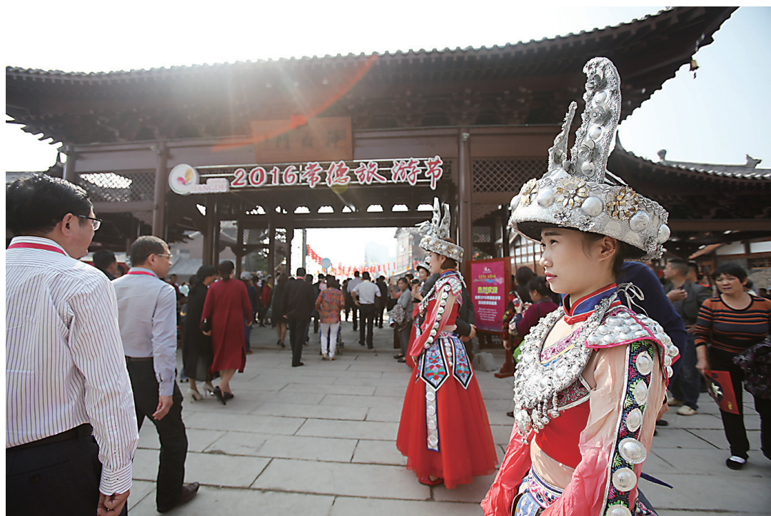
2016 常德旅游节开幕，国内外游客纷纷入场。

而在这两天时间里，“湖南旅游‘金三角’发展峰会”、“2016常德旅游节开幕式暨穿紫河首航夜游”、“常德河街开盘”、“七