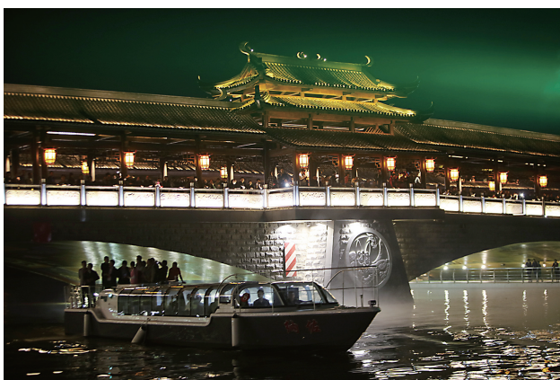
开幕式上，500多宾客乘坐游艇，共同观赏穿紫河夜景。

在开幕式现场演绎的“穿紫渔歌”、“依水筑城”、“河街旧事”、“浪漫之旅”四大篇章，将在场观众带入一个光影辉映、人水和谐的美好境界。在乘“水上巴士”沿穿紫河游览中，沿线11公里长的河道两岸展现了常德老河街原景、折子戏、常德丝弦、刘海砍樵音乐剧等实景演出。配上梦幻的灯光特效，常德本地民俗文化溶于水，打造了一场古典与现代结合的唯美大赏。