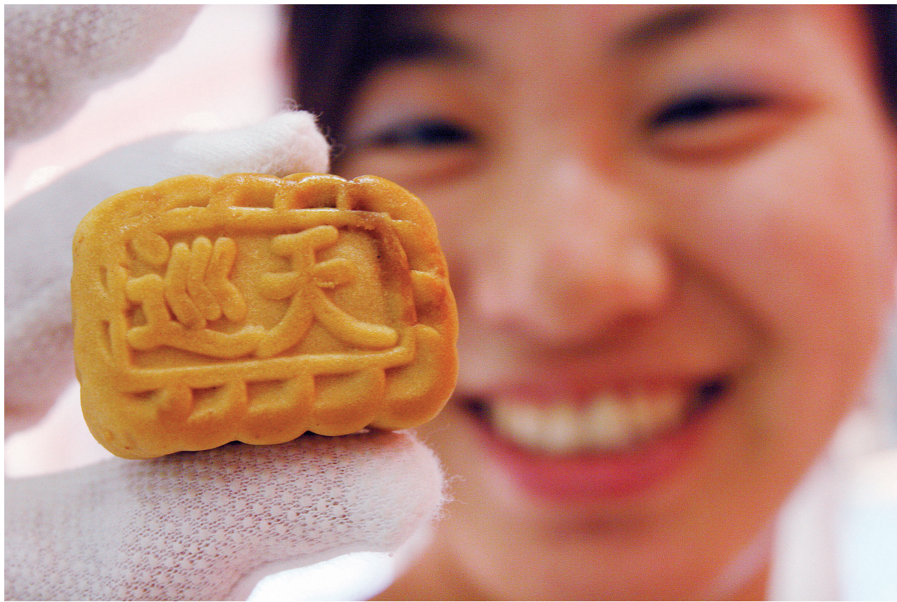
巡天月饼、五香卤汁牛肉、航天冰淇淋、麻辣烧烤牛肉等，航天员太空食品在北京展出，让参观的市民大饱眼福。