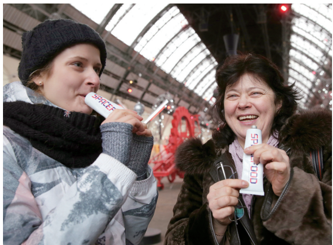
想尝下宇航员们食物是什么味？在俄罗斯展览中心的自动贩卖机前，人们就能购买宇航员在外太空吃的管状食品。