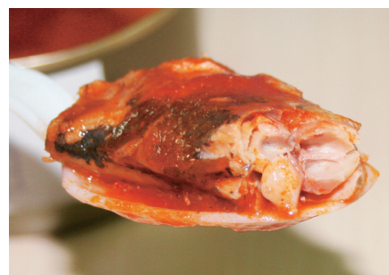
茄汁沙丁鱼罐头，让中国宇航员在太空吃得很快。