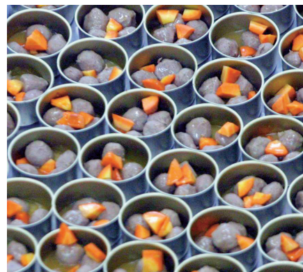
不要以为航天员吃得差，咱中国做的航天食品鲍鱼丸够“高大上”吧。