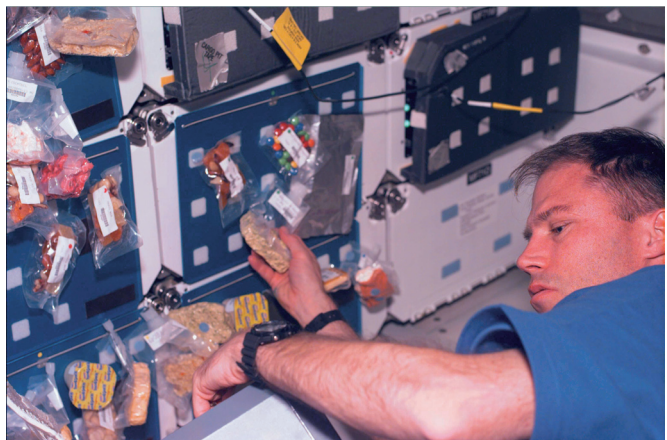
太空食品已经从“牙膏包装”“糊状食品”等老套路上跳脱出来，宇航员在太空也能吃到与地面食物外观和口感一致的零食。