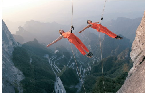
两名舞者在天门山玉壶峰崖壁演绎悬崖舞蹈。

9月12日到13日，来自美国的Bandaloop高空舞蹈团在天门山险峻的悬崖峭壁上，表演以“翩跹云界，飞越极限”为主题的“空中芭蕾”，以优雅而又惊险的舞姿，通过与鬼斧神工般自然奇景的交映，全新诠释舞蹈的内涵，重新界定舞蹈的想象空间。