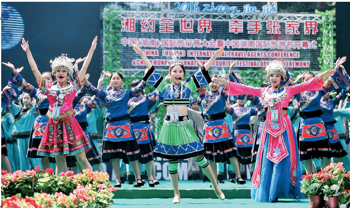
活动开幕式就是一场视听盛宴。