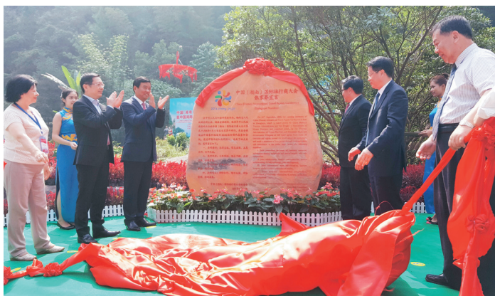
《世界旅行商合作张家界宣言》纪念碑揭幕是开幕式一大高潮。

国际旅行商代表集体发表宣言在中国尚属首次，这也必将对全球旅游发展产生深远的影响。