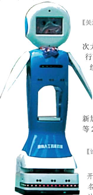
呆萌机器人导游“小+”。

9月12日至14日，张家界市城区的澧水河上，多名滑水运动员用叠罗汉的形式，表演水上金字塔+特技滑水。此外，还有高难度水上飞人展示、立式花样摩托艇项目、F4中国方程式PK赛等表演向游客们展示摩托绝技。