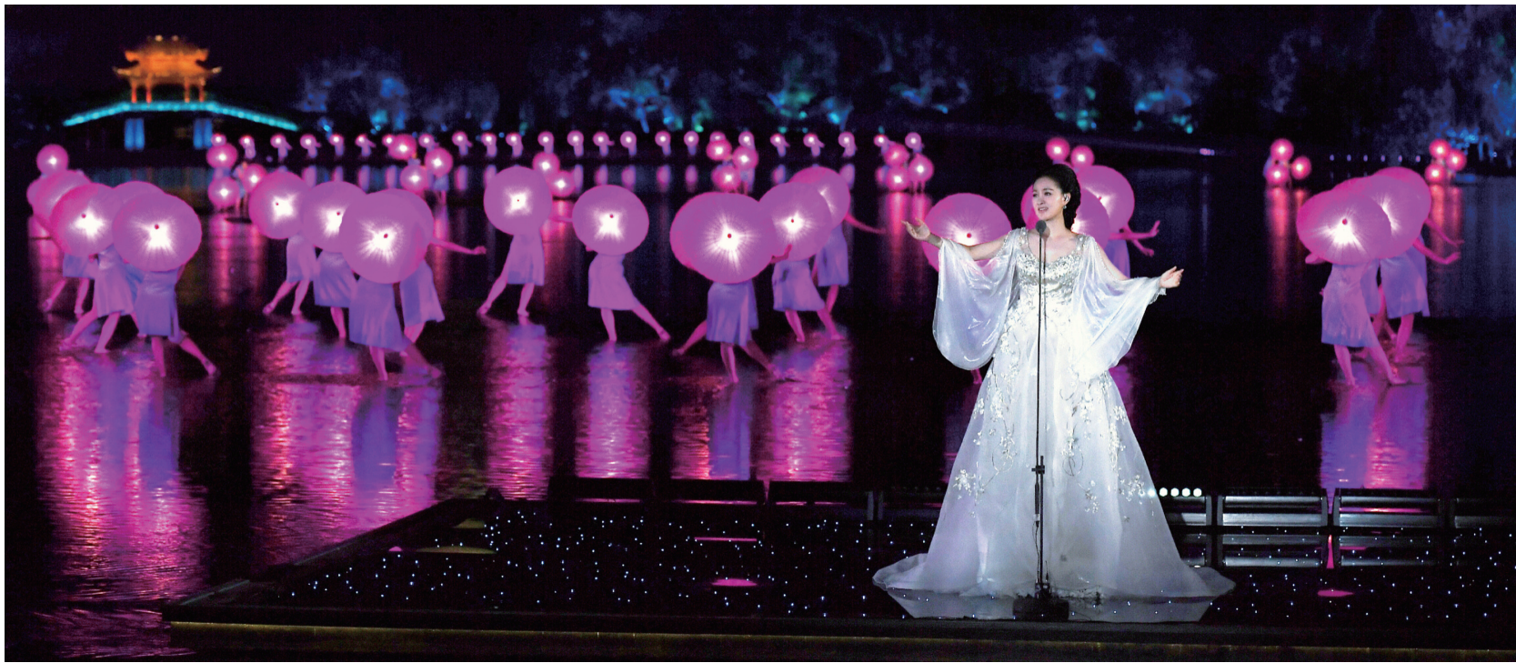
雷佳在 G20 峰会文艺演出上，压轴独唱《难忘茉莉花》。