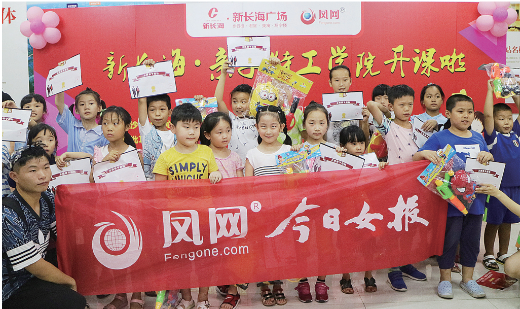
“小特工”们怀抱赢得的给力奖品快乐合影。

据悉，作为星沙 CBD 核心和一站式时尚街区的新长海广场，首批 10—50m 2 临街旺铺开盘在即，感兴趣的朋友，可以前往新长海售楼中心或拨打电话 86385888 咨询。