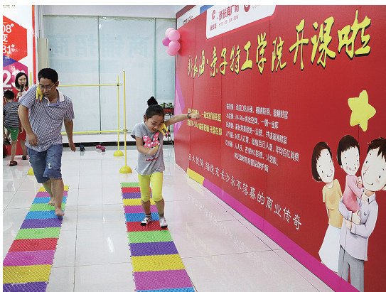
和爸爸一起游戏，动力无限，在趾压板上也能健步如飞。