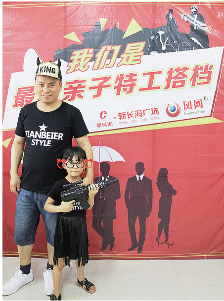
亲子特工搭档们酷翻全场。