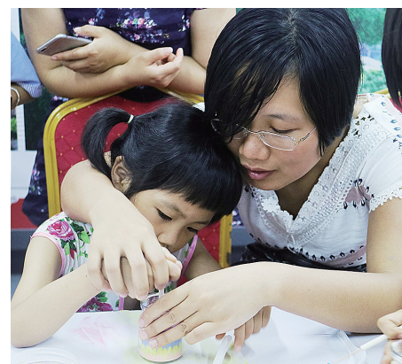
大手握小手，一起 DIY 魔幻沙画。