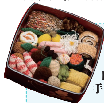
■链接 日本主妇巧手“织”美食

近藤的整理理论独一无二，可以简述为一个基本原则：感谢那些要退役的东西曾为你服务，然后扔掉所有不能让你“怦然心动”的东西。对近藤来说，整理物品不仅能改善居住环境，还会影响到精神世界。