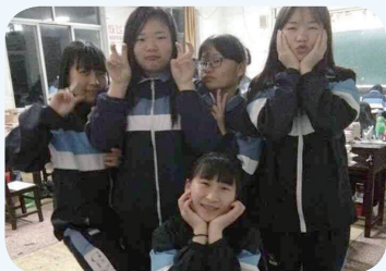
益阳某高三学生高考后合影留念。