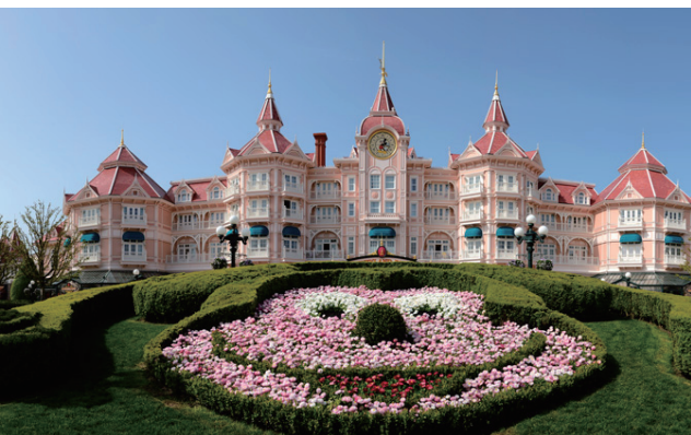
法国巴黎迪士尼乐园。