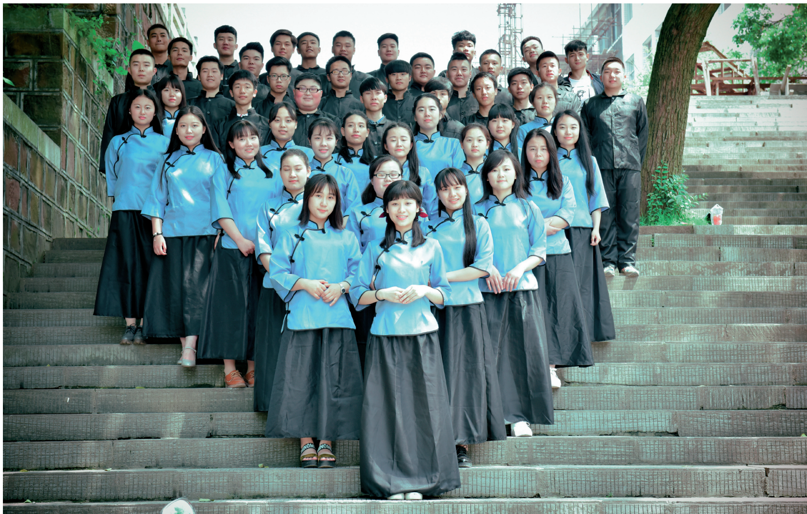
5月30日，湖南麻阳苗族自治县第一中学高三14班的学生穿上民国服装，留下“穿越”的记忆，也展望更美的青春。