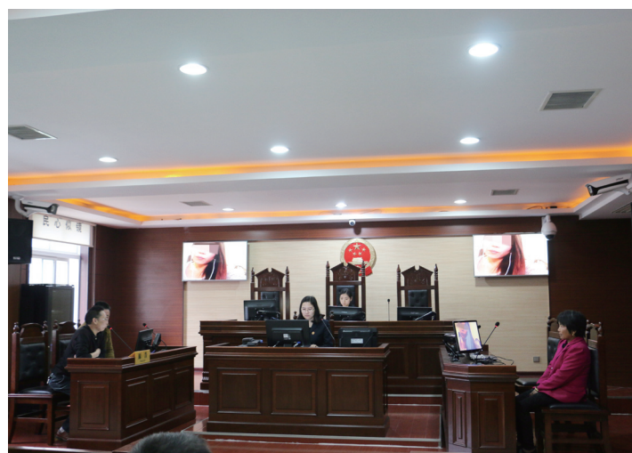
湖南首例“微信庭审”现场。被告虽远在美国, 但通过微信视频的方式, 她仍全程参与了庭审。

5 月 12 日, 是沅江市人民法院审理黄勇与闫丽的离婚纠纷案的日子。闫丽早早到场, 但黄勇