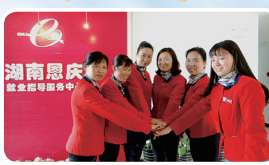
省直——湖南恩庆代表队