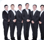
岳阳——岳阳家政精英代表队