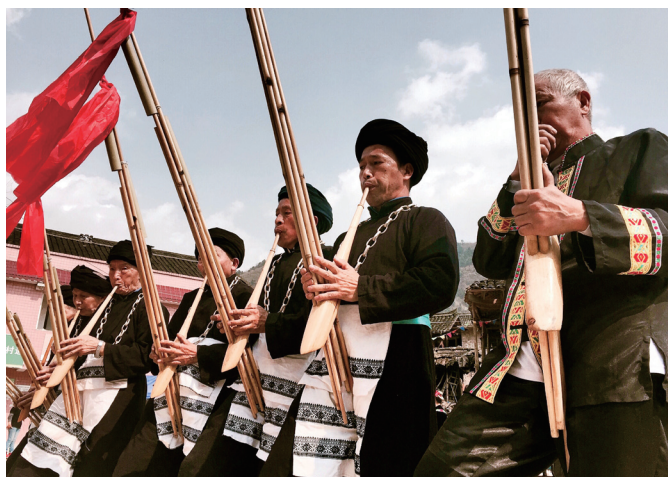
↑ 凯里民族风情浓郁。 ↓ 热情的苗妹。

“向西六百公里 湘遇山水凯里。”夏天，凯里凉爽的气候，对于“火炉”中的长沙市民而言，有着格外“清凉”的吸引力。随着高速铁路的开通和贵州县县通高速的实现，从长沙到凯里以前漫长的600公里旅程，已被高铁缩短到3个小时，而四通八达的高速公路可以让游客白天在少数民族村寨中体验原生态文化，夜晚在凯里享受现代化的旅游设施和服务。