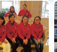
张家界——张家界市博悦精品月子会所