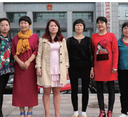
益阳——益阳市妇联、市家政协会代表队