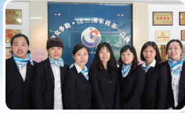
长沙——湘女家庭服务队