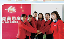
省直——湖南恩庆代表队