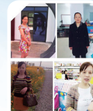
常德——常德市巾帼家政服务队