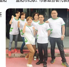
湘西州——泸溪县鸿瑞家政服务有限公司