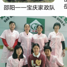
永州——好帮手家庭服务有限公司