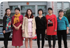
益阳——益阳市妇联、市政协代表队