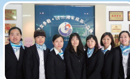
长沙——湘女家庭服务队