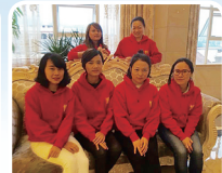
张家界——张家界市博悦精品月子会所