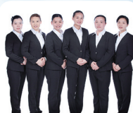
岳阳——岳阳家政精英代表队