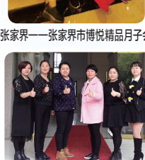
怀化——怀化家政服务代表队