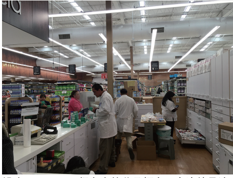
设在superama超市内的药品柜台，旁边就是诊室。

最开始，我们驱车前往一家位于写字楼的诊所，结果却吃了“闭门羹”。翻译也无奈：只要是休息日，墨西哥很多场所都会停业。抱着持续高烧浑身无力的女儿，我们辗转来到第二家——位于当地连锁