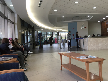
ABC医院的大厅，室内布置非常舒适，病人不多，气氛轻松。

值得一提的是，墨西哥的医院没有“药房”一说，医院和药店是分离的。医院有处方但不能卖药，除非是住院的病人才能从医院买药。医生不指定患者必须到哪家药店去购买，而药店原则上必须要看到医生的处方单之后才能卖药给你。