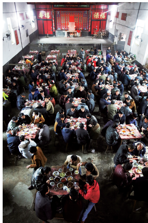
舞龙时间一般在每年元宵节前后的夜晚7时左右。在此之前，村里人要热热闹闹吃上一顿，还要到祠堂举行祭祖仪式，设案、焚香、作揖、施叩礼。

在龙珠转动的指引下，“香火龙”行走在田间，倒影越过水面，星光熠熠，把整个村庄绕圈一周。最后，“香火龙”带着新一年风调雨顺、五谷丰登的美好希望回到祠堂，男女老少开始了新春最后一天的大狂欢。