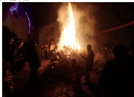
舞龙结束后，舞龙者将龙点燃，第二天将焚化的龙灰装好倒进河里，寓意“化龙归海”，并祈求一年风调雨顺，五谷丰登。