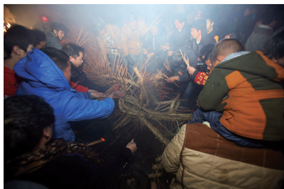
在人们的呐喊、赞叹和吹呼中，猴形的龙灯被舞得如同一团耀眼的光球。