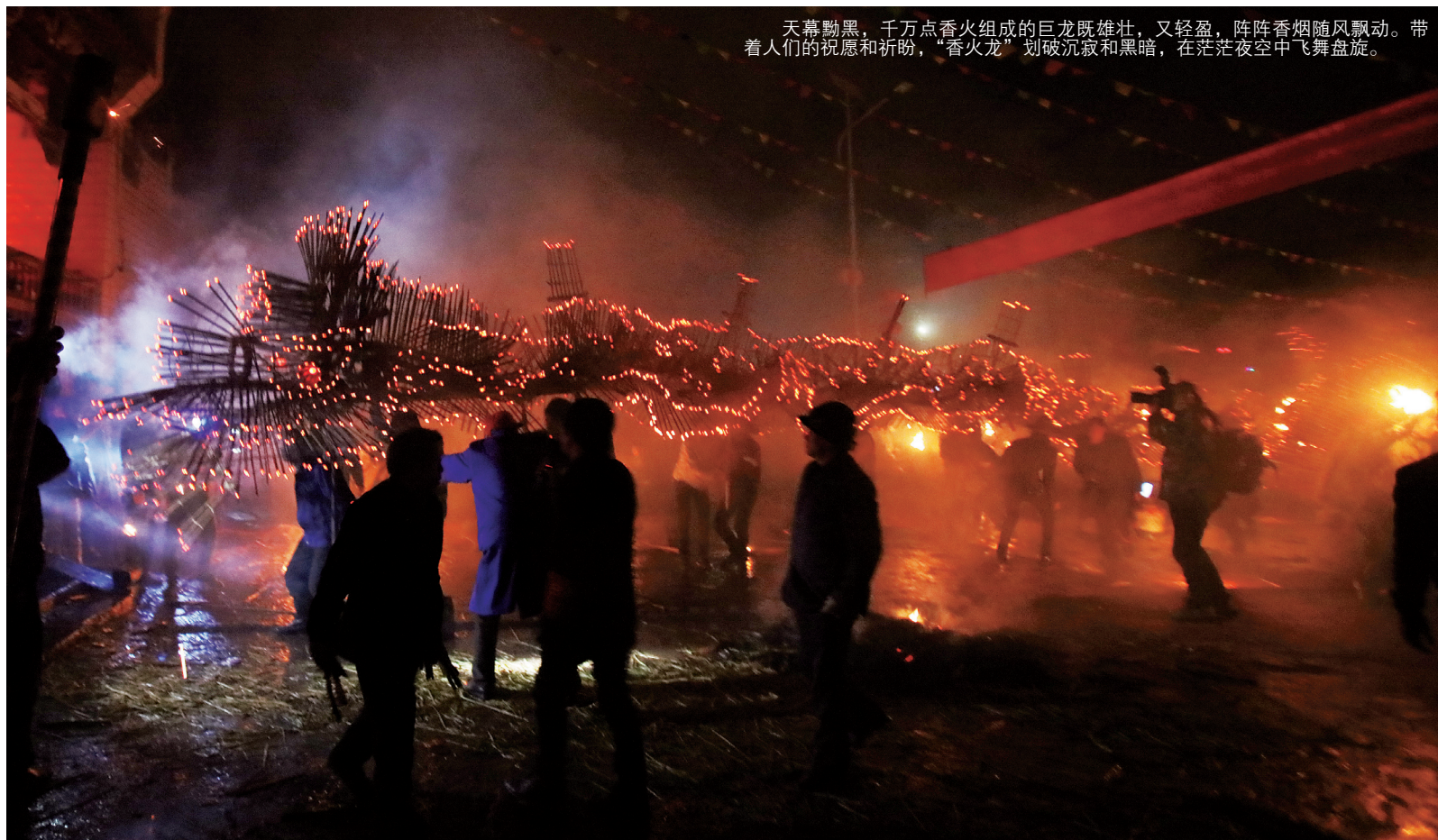
天幕黝黑，千万点香火组成的巨龙既雄壮，又轻盈，阵阵香烟随风飘动。带着人们的祝愿和祈盼，“香火龙”划破沉寂和黑暗，在茫茫夜空中飞舞盘旋。