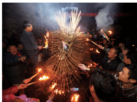
游客和村里的男女老少纷纷持松明火把给“香火龙”和各式吉祥物点火，加上几十盏红光闪闪的龙灯，一片珠光宝气。

在湖南汝城，每年春节期间，各大村庄都会在暗夜中升腾起一条条与众不同的“香火龙”——见惯了普通的舞龙表演，这“星火”闪耀的“香火龙”，让人不觉耳目一新。