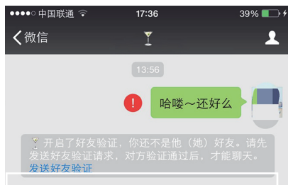
两年不联系，却被前女友拉黑。

“她居然把我拉黑了！！！” 大半夜的，我哥们儿大白给我发来这样的信息。他一向是性情平稳的男人，从不会在深夜打扰别人，也不会如此气愤，出啥事了？