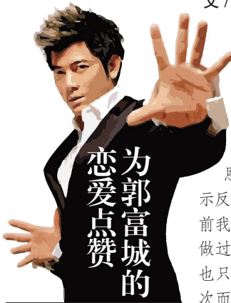
为郭富城的恋爱点赞

我特别佩服郭天王到如此年纪,还能拥有这样的生活热情。他没有一个单身老男人的猥琐颓废感,他的身材至少可以看出,他热爱生活,并且不懒惰。他不顾一切公开和小女友的恋爱,可见这段爱情,让他多么的幸福。如果你年过半百,还能遇到这样的爱情,你是希望得到别人的祝福,还是恶评?